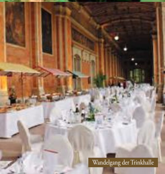
Wandgang der Trinkhalle